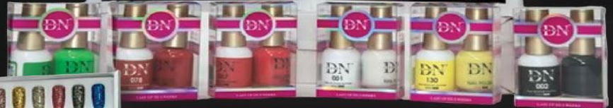
DN COLLECTION SET 266 COLORS