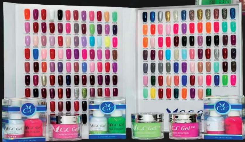
CNC 3IN1 TRIO 189 COLLECTION