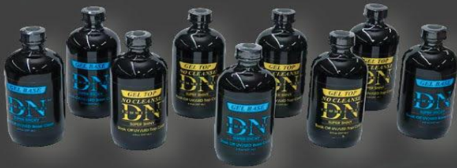
DN GEL BASE COAT / TOP COAT

Discover our unbeatable deals and take advantage of the best offers available at incredibly competitive and low prices.