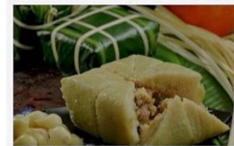
BÁNH CHƯNG - $27 (4 lbs)