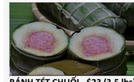
BÁNH TÉT CHUỐI - $23 (3.5 lbs)