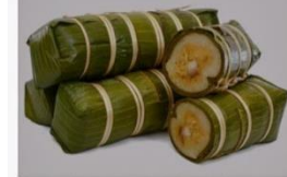
BÁNH TÉT MẶN - $23 (3.5 lbs)